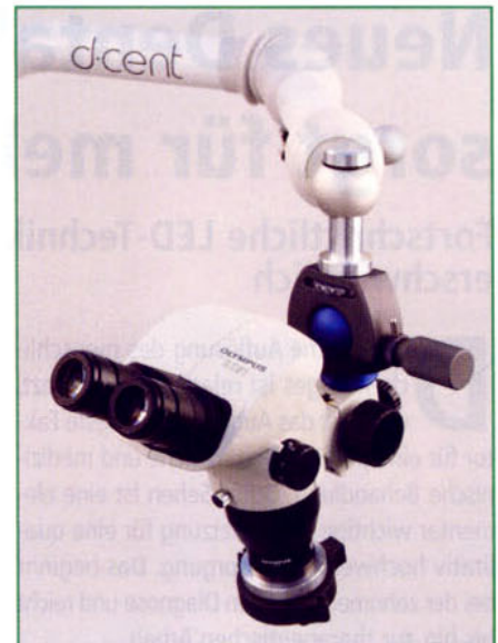
Der Gelenkarm ermöglicht eine ermüdungsfreie ergonomische Sitz- und Arbeitshaltung

Seit einem Jahr befindet sich das Mikroskop in der Erprobungsphase in unterschiedlichen Zahnarztpraxen in Deutschland, Finnland und Belgien. Es konnte durch die Anregungen